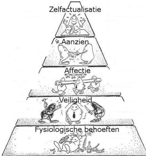
Piramide van Maslow